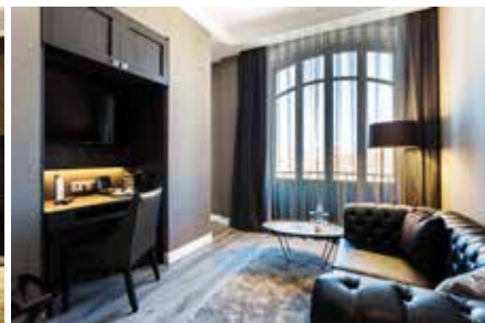
13 Junior Suite