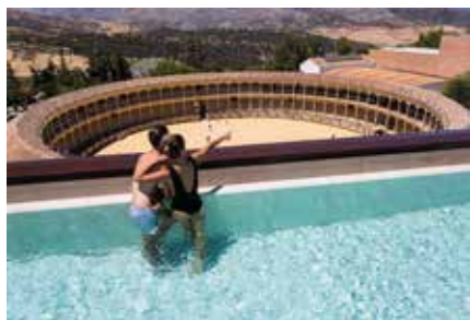
Piscina / Swimming pool