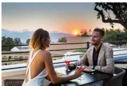
Terraza / Terrace